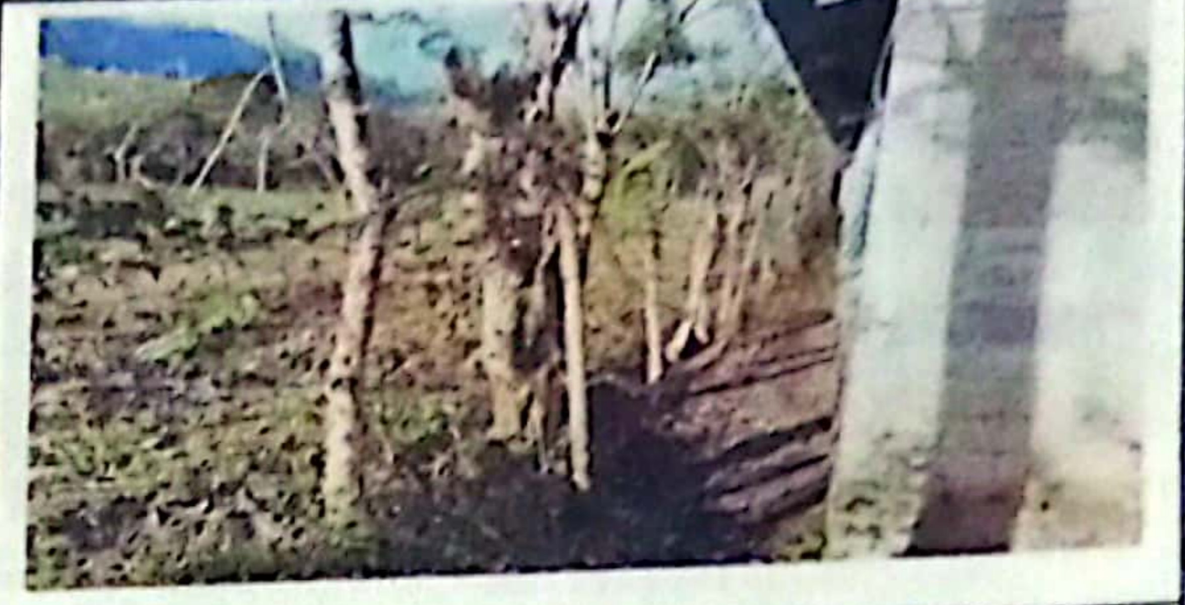
sustitución de cerco y muro perimetral, se observa en mal estado ya que esta sostenido con palos de madera