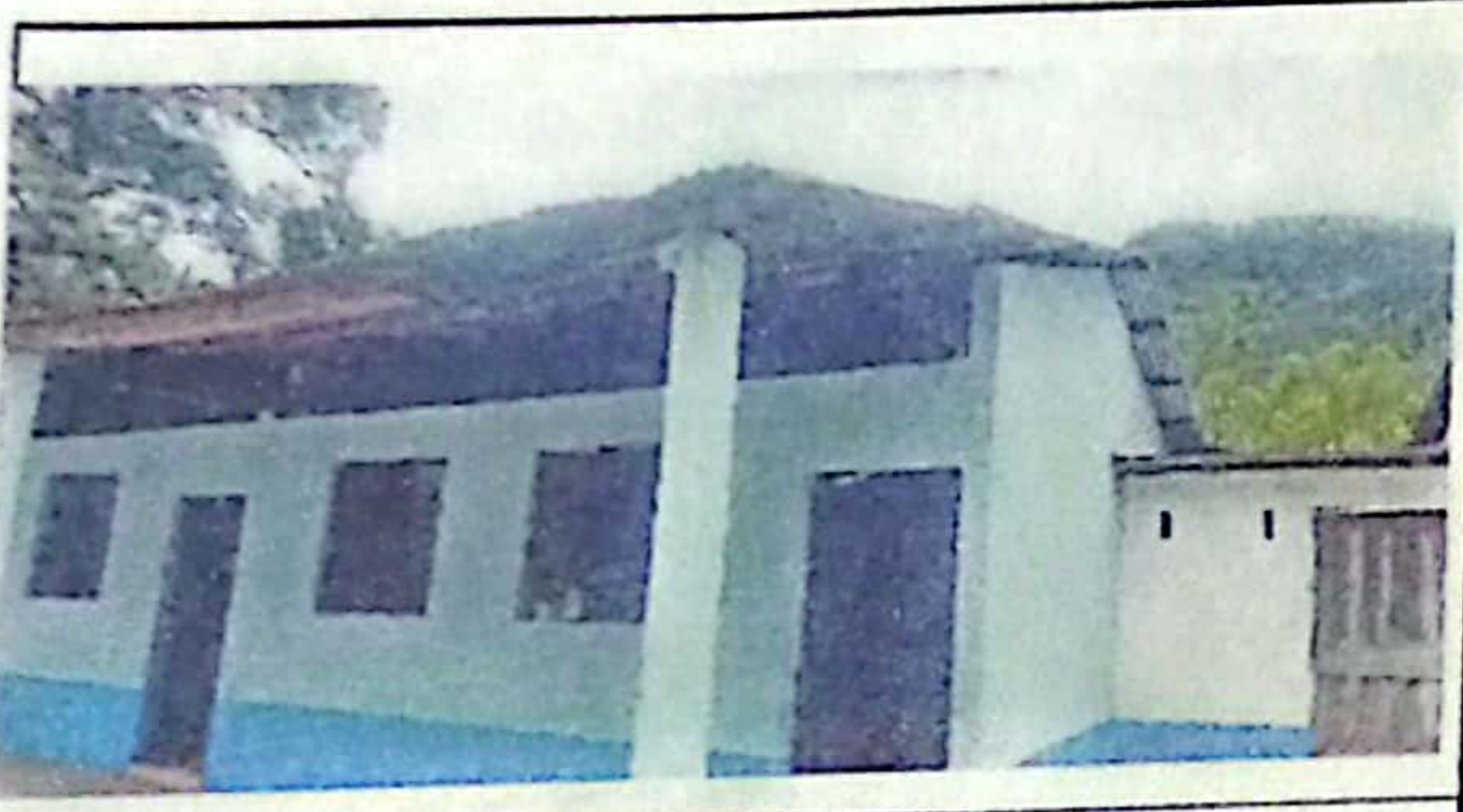
FOTO 3: En esta fotografía se logra observar el mal estado en que se encuentra las reglas y tijera del entechado.