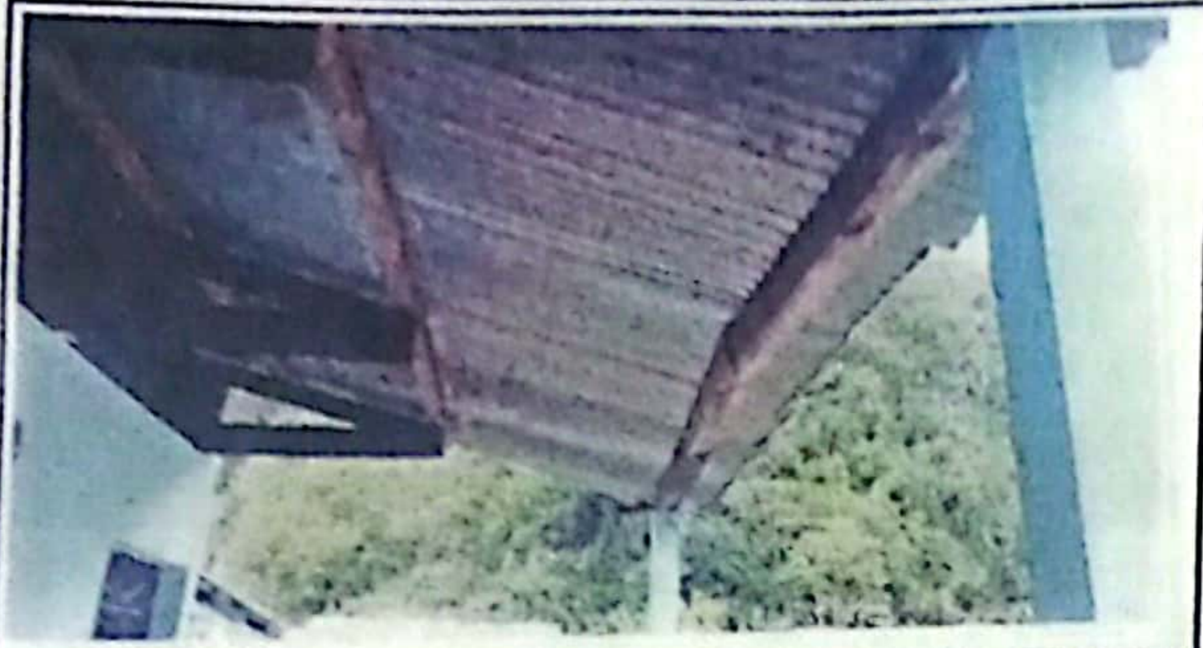
FOTO 1: En esta fotografía se logra observar que está deteriorado la regla del edificio.