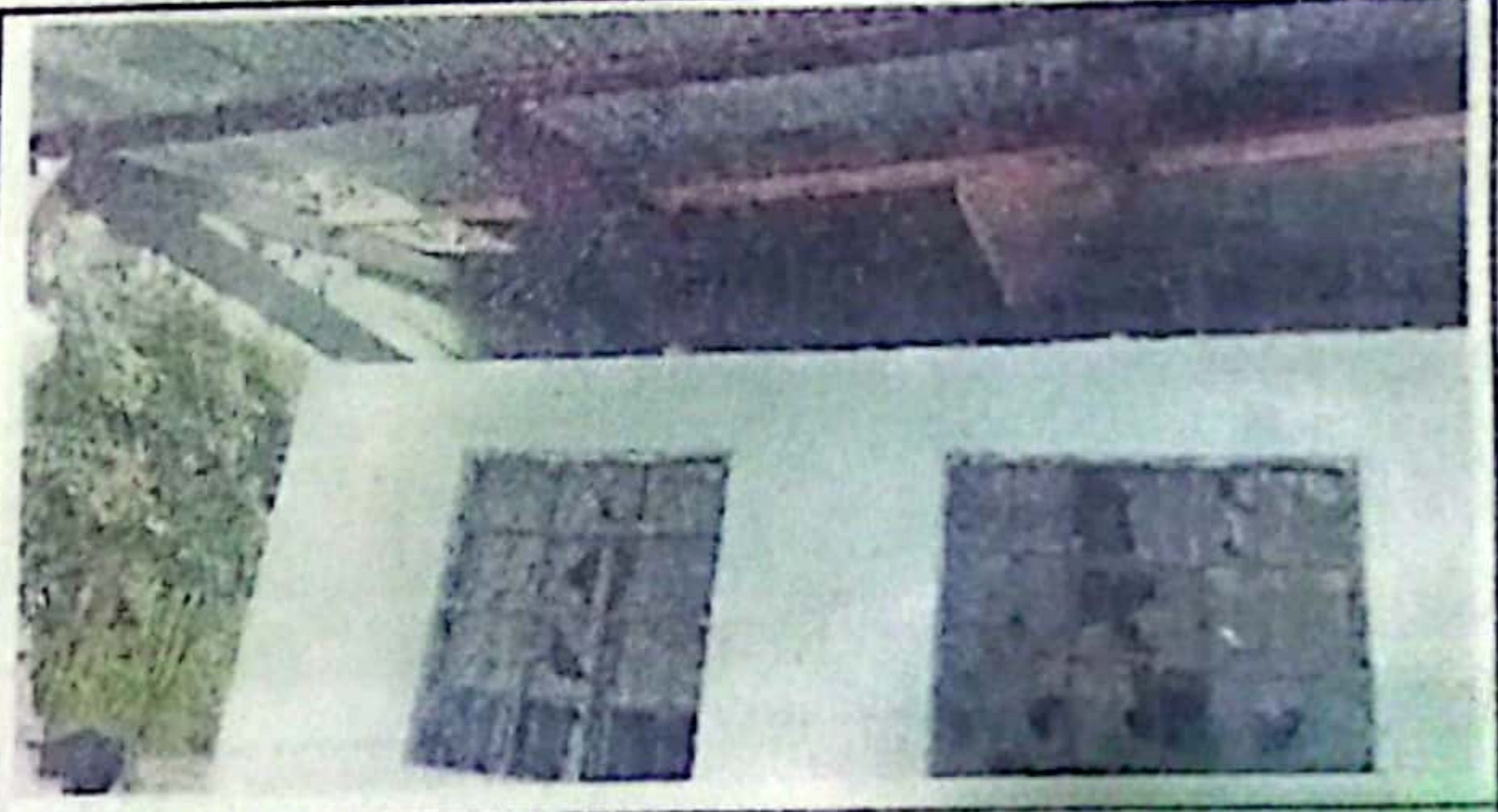
FOTO 6: En esta fotografía se logra observar las vigas en mal estado.

Observación: Si es necesario se pueden agregar hojas adicionales y actualizar el número de hojas.