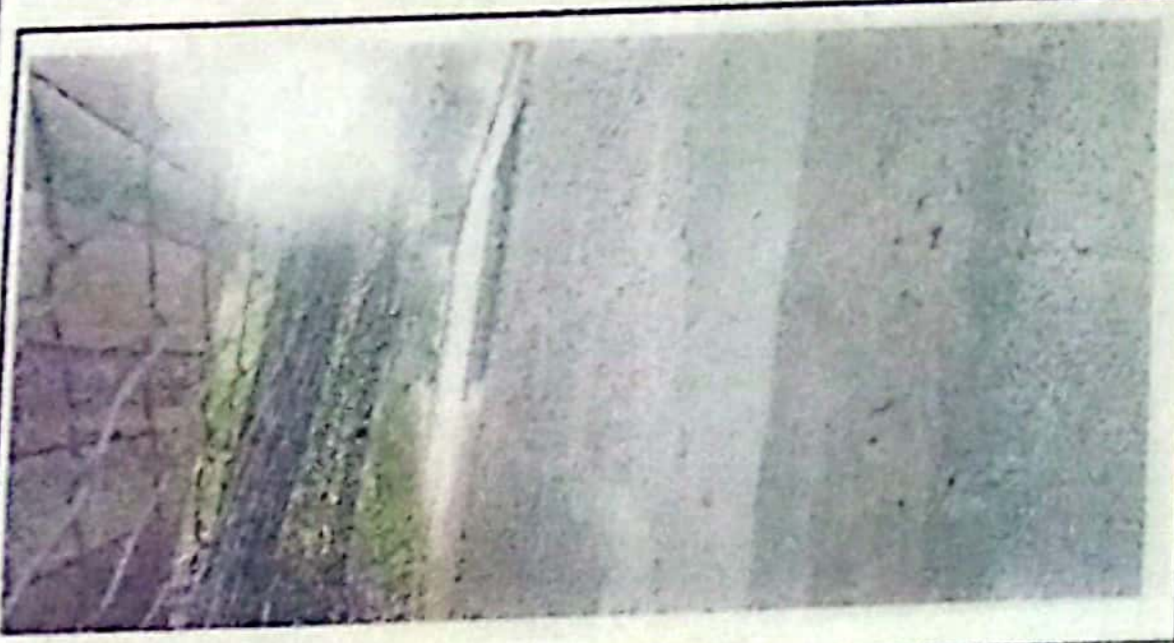
FOTO 5: Se observa que el cerco del área perimetral se encuentra en mal estado.